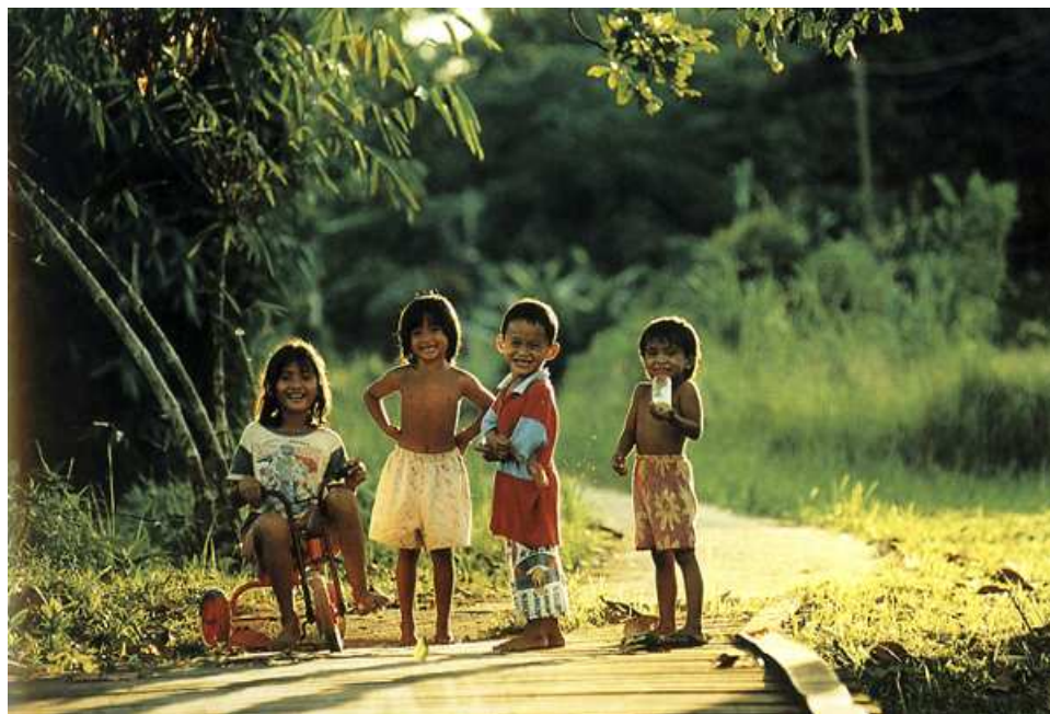
King Twang Wong – Malaysia

Selezione di immagini dal libro – pagine 230 ca – Stampato dalla FIAF – anno 2000