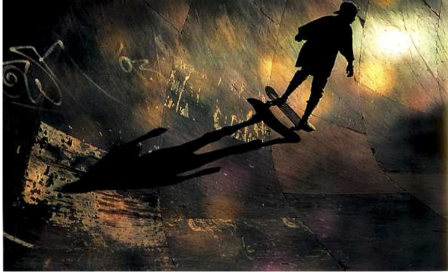
Karlo Engeln – Germany