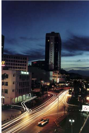
Ah Kai Chin – Malaysia