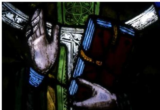
gt – vetri in S. Croce