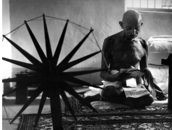
Margaret Burke White – “Gandhi” – India 1946