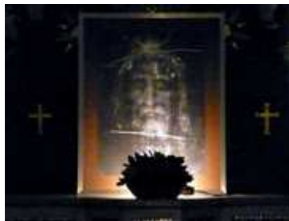
gt - Torino