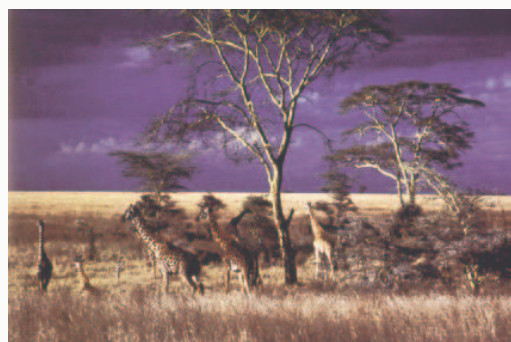
sotto: immagini dal libro di Vannino Santini